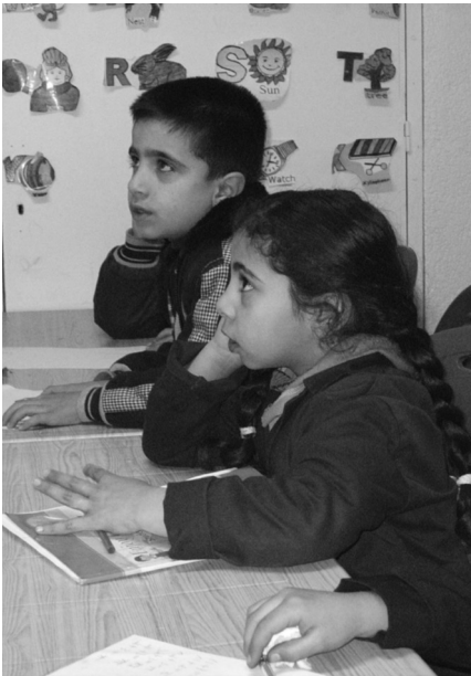
Nachhilfe in Schatila, „Spielwiese“ auf dem Dach, Raum für Nachhilfkurse und Veranstaltungssaal mit Bühne

Seit September sind die drei neuen Stockwerke des bisher zweistöckigen Sozialzentrums unserer Partner von NISCVT fertig und werden intensiv genutzt. Im zweiten Stock finden nun vor allem die von uns finanzierten Nachhilfkurse statt. Die kleinen Grundschulrinnen und -schüler haben jetzt genügend Platz und Tageslicht zum Lernen. In den Pausen können sie auf der bunten Dachterrasse spielen und toben. Auch die Kindergartenkinder, die im ersten Stock untergebracht sind, nutzen begeistert die neue „Spielwiese“ auf dem Dach. Im Veranstaltungssaal mit Bühne im dritten Stock konnten als erstes die Gedenkfeiern zum 30. Jahrestag des Massakers von Sabra und Schatila stattfinden. In Zukunft werden hier alle Treffen, Kurse und Feste stattfinden, die für eine größere Zahl von Teilnehmern gedacht ist. Auch Musik-, Tanz- und Theatergruppen können dort jetzt regelmäßig üben und Aufführungen machen. Die kleine neue Bücherei ist für interessierte Leser geöffnet. Die Sozialarbeiterinnen und Erzieherinnen des Zentrums sind nach 28 Jahren in beengten und dunklen Räumlichkeiten im Glück und gehen mit neuem Elan an ihre Arbeit.